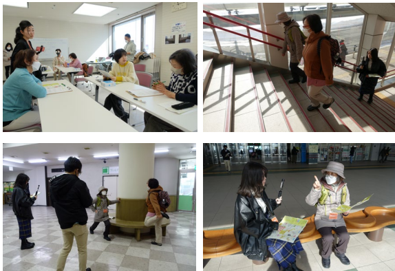
2024年3月に実施したモニター調査の様子