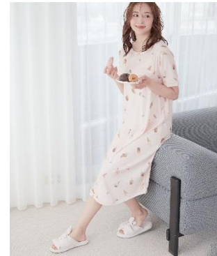
「胸ポケワンピース」