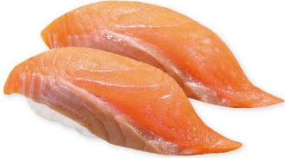
【北海道産】北海道サーモン 240円