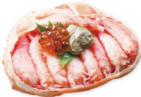
極上かに玉手箱 990円