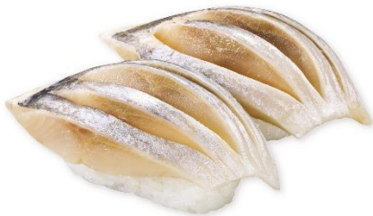
【北海道産】とろにしん 115円