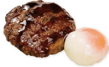
まぐろつくね 250 円 販売期間:7月5日(金)~8月8日(木) ※お持ち帰り不可

くら寿司特製のうどんつゆを使用したぶっかけうどん。トッピングの大根おろしに南高梅を和えることで、梅の爽やかな風味が広がります。梅と豚しゃぶの相性も良く、後味さっぱりなので、夏にぴったりの一品です。よく混ぜてお召し上がりいただくのがオススメです。