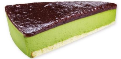
抹茶とあずきのケーキ 300 円 販売期間:7月5日(金)~7月18日(木)

静岡県産抹茶を使用した抹茶ムースに、北海道産小豆を使用したつぶあんを組み合わせた和風ケーキ。抹茶のほろ苦さが、つぶあんの甘みと相性抜群でクセになる美味しさです。