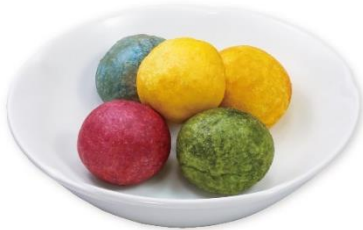
おいもちボール 330 円 販売期間:7月5日(金)~8月8日(木) ※お持ち帰り不可

タピオカ粉を練りこんだモチモチ食感の生地の中に、甘いさつまいも餡や紫芋餡を詰め込みました。黄色・紫色・水色・緑色と4色からなるカラフルなボール状で、見た目も可愛いスイーツです。ご家族やお友達とシェアしながらお召し上がりいただくのもオススメです。