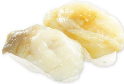
【北海道産】生ほっき貝二種盛り 345円