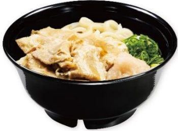
豚しゃぶ梅おろしぶっかけ 450 円 販売期間:7月5日(金)~9月5日(木) ※お持ち帰り不可

くら寿司特製のうどんつゆを使用したぶっかけうどん。トッピングの大根おろしに南高梅を和えることで、梅の爽やかな風味が広がります。梅と豚しゃぶの相性も良く、後味さっぱりなので、夏にぴったりの一品です。よく混ぜてお召し上がりいただくのがオススメです。