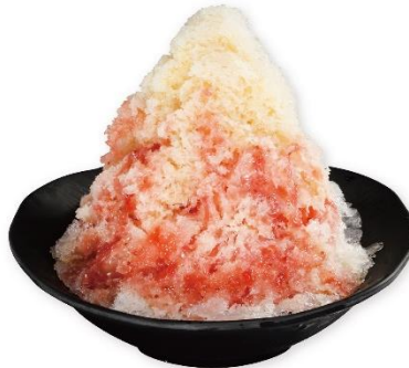
夢のふわ雪 ミルキーいちご 400 円 販売期間:7月5日(金)~9月5日(木) ※「原宿店」では販売していません。

タピオカ粉を練りこんだモチモチ食感の生地の中に、甘いさつまいも餡や紫芋餡を詰め込みました。黄色・紫色・水色・緑色と4色からなるカラフルなボール状で、見た目も可愛いスイーツです。ご家族やお友達とシェアしながらお召し上がりいただくのもオススメです。