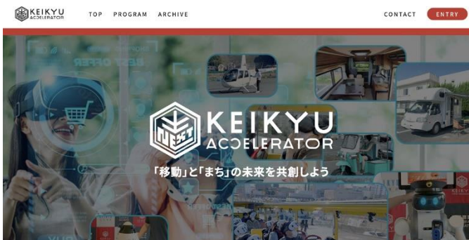
KEIKYU ACCELERATOR PROGRAM WEBサイト

京急電鉄では，地域課題の解決に向けた具体的取り組みと，スタートアップのアイデアを融合させることで，横須賀市が抱える地域課題の解決を目指すとともに，再開発が進む横須賀中央駅・追浜駅などのまちづくりの共創パートナーと新規事業創出などに取り組んでまいります。詳細は別紙のとおりです。