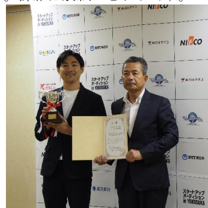
スタートアップオーディション in YOKOSUKA（昨年度）