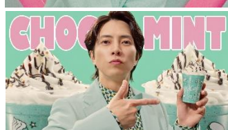
チョコミント♪（男性）