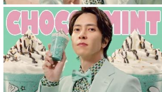
チョコミント♪（男性）