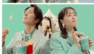
【2人】 しあわせすぎるっ！