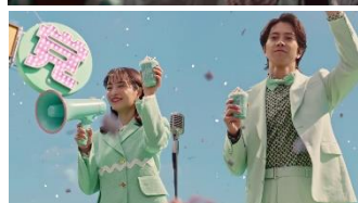
【広瀬さん】 チョコミン党の皆さん！