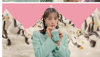
チョコミント♪（女性）