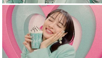
【広瀬さん】 さわやか！ かわいい！