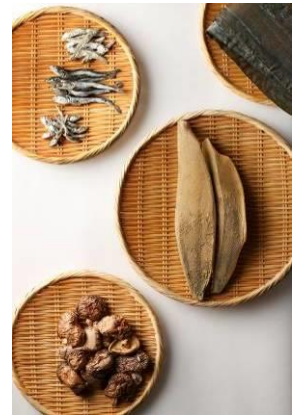
「和食の日」×おいしい日本橋老舗の ワークショップ