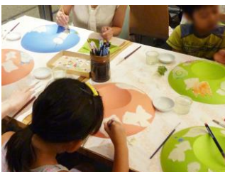
ハレ EDO キッズ縁日 (イメージ)

今年で8回目となる、着物文化を発信し街に賑わいを創出するイベント。恒例の「日本橋 橋上」で行われる「きもの大集合写真」(10/26開催)をはじめ、着物のレンタル・着付けがリーズナブルに体験できる「きものレンタル・着付け」、「きものステーション」を和室レンタルスペース「橋楽亭」にて実施。