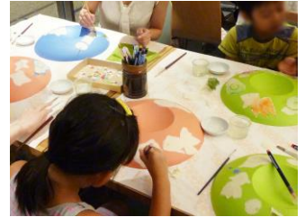
ハレ EDO キッズ縁日 (イメージ)

対象店舗： コレド日本橋、コレド室町、コレド室町 2、コレド室町 3、日本橋三井タワー（コレド室町タワーダイニング含む）