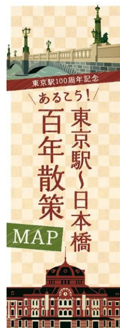
東京駅開業 100 周年記念 「あるこう！東京駅～日本橋 百年散策」

TEL 03-4570-3181 FAX 03-4580-9132 tsc_pr@ml.prap.co.jp