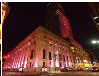
ライトアップ (2014年春の様子)