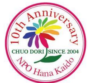
はな彩る中央通り 花壇デザインショウ