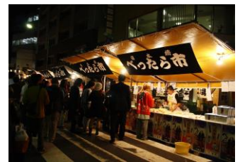
「日本橋の秋まつりスタンプラリー (べったら市の様子)

内 容： 秋の日本橋祭事を巡るスタンプラリー企画。日本橋案内所で台紙を受取り、いずれかの祭事会場でスタンプを押印。台紙を日本橋案内所にお持ちいただくと、日本橋の老舗が提供する粗品をプレゼント。日本橋エリアで行われる伝統的な祭りと街巡りをお楽しみください。