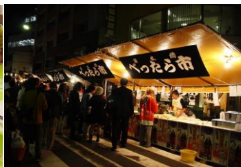
「日本橋の秋まつり」スタンプラリー (べったら市の様子)