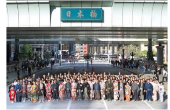
きもの大集合写真 （2013年開催時の様子）

W E B：http://www.nihonbashi-tokyo.jp/kimono2014/（10/9頃公開予定）