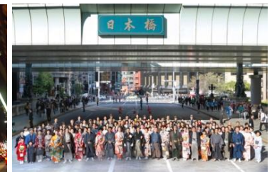
きもの大集合写真 (2013年開催時の様子)