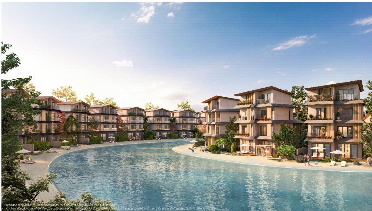
「Vu Yen プロジェクト (Royal Island) 」完成予想パース

野村不動産株式会社（本社：東京都新宿区、代表取締役社長：松尾 大作、以下「野村不動産」）、株式会社海外交通・都市開発事業支援機構（東京都千代田区、代表取締役社長：武貞 達彦、以下「JOIN」）、東神開発株式会社（本社：東京都世田谷区、代表取締役社長：倉本 真祐、以下「東神開発」）、大成建設株式会社（本社：東京都新宿区、代表取締役社長：相川 善郎、以下「大成建設」）は、ベトナムのハイフォン特別市、Vu Yen 島において、同国最大手の不動産デベロッパーである Vinhomes 社（ベトナム ハノイ市/会長 Pham Thieu Hoa、以下「VHM 社」）が推進する「Vu Yen (ヴーイエン) プロジェクト (Royal Island)」（以下、本プロジェクト）のうち、敷地面積約 23.9ha、1,550 戸の住宅等を整備する大規模都市開発事業（以下、本事業）に参画したことをお知らせいたします。