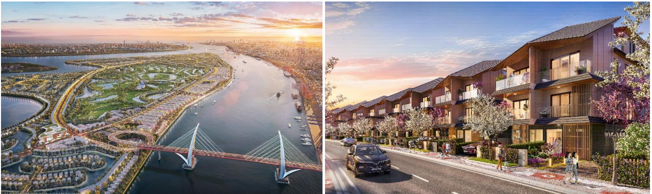
「Vu Yen プロジェクト (Royal Island)」完成予想パース

本事業は、約 23.9ha の中に 1,550 戸の住宅等を整備する大規模都市開発事業であり、連棟住宅（タウンハウス）の他、2戸連棟住宅（セミデタッチドヴィラ）、戸建住宅（ヴィラ）の開発を予定しています。野村不動産、JOIN、東神開発、大成建設がこれまで国内や海外で培ってきた住宅開発事業の知見を活かした商品企画や、施工品質管理を行うことにより、安心・安全かつ良質な住宅の整備・供給を行ってまいります。また、世界的に著名な建築家である隈研吾氏を起用し、川に囲まれた島というロケーションを活かし、「自然との調和」をテーマとした商品設計を行いました。