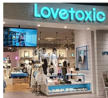
参考: 「ラプトキシック」直営店