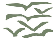
盛岡市立図書館 MORIOKA CITY LIBRARY

ロゴマーク、メインビジュアル、館内のグラフィックパターン、サインを地元のクリエイティブ事務所homesickdesignと共に担当。ロゴマークは、飛来する鳥たちと、開いた本のシルエットを重ね合わせ盛岡市立図書館らしさのあるデザインとしています。高松の池を訪れる白鳥や多種多様な野鳥のように、図書館に盛岡の知や人が自然に集い、さまざまな活動を通して、新たな地（知）へと羽ばたいていってほしいという願いが込められています。