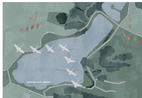
メインビジュアル