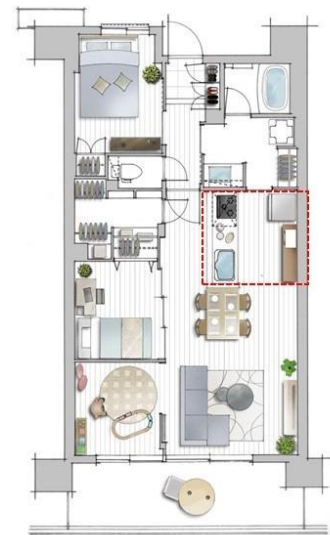
(左) 廊下付けキッチンイメージ図 / (右) 廊下付けキッチンタイプ