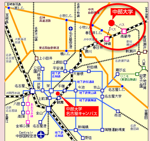
中部大学 (春日井市松本町 1200)

日時： 6月15日(土) 午後1:15~4:30 (12:30~受付開始) 場所： 中部大学春日井キャンパス (不言実行館2階) アクセス： J R中央線「神領」駅下車、北口中部大学バス停より 直通バスにて10分 (12:10, 12:30 12:50 発) 車の場合は、正門から入り指定の駐車場へ 内容： AIと英語教育の関係に関する実践報告、シンポジウム 参加費： 無料 参加方法： 当日会場まで (事前申込の必要はありません) 希望者にはオンライン配信を予定 (要事前連絡) 問い合わせ： 0568-51-7248 shioz@isc.chubu.ac.jp