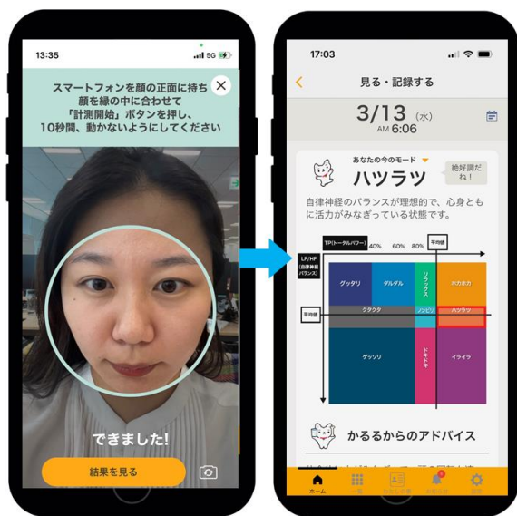
【カルテコの画面イメージ】