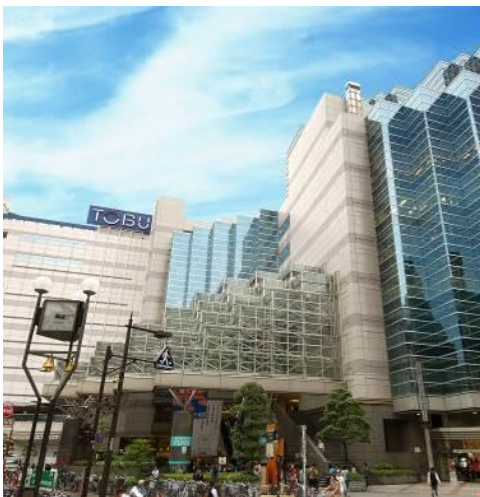
↑ 東武百貨店 池袋本店

池袋駅西口の東武百貨店池袋本店とルミネ池袋は、建物が一体になっており、行き来しやすい構造です。両店が手を組んでイベントを開催しファッションスポットとしての魅力を発信することで、来街者の増加と池袋西口地区の活性化をめざします。