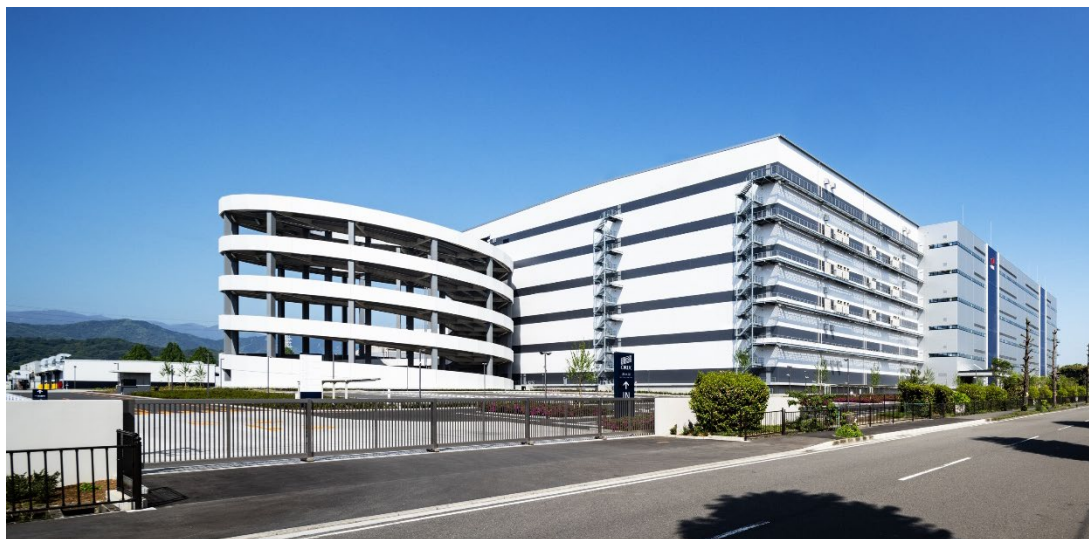
「厚木Ⅲロジスティクスセンター」外観

なお、本物件は竣工時点で5社と賃貸借契約を締結しており、契約率100%で稼働を開始します。