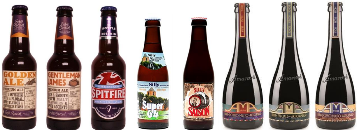
左より、「ゴールデンエール」、「ジェントルマンジェームス」、「スピットファイヤー」、「スーパー64」、「セゾンシリー」、「アマルコルド ブルーナ」、「アマルコルド ピオンダ」、「アマルコルド モーラ」

また、この他にも新たに、ボトルデザインがおしゃれなイタリア産ビール・発泡酒3種類（各399円・355ml）の取扱いを開始し、グローバル調達網を活用してバラエティ豊富な直輸入ビールを圧倒的低価格で提供いたします。