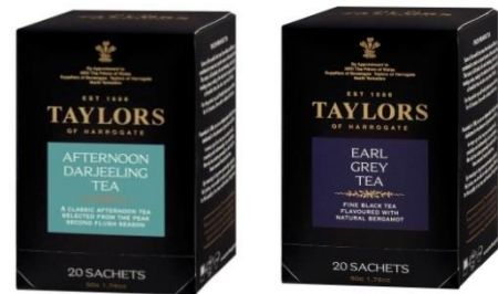
テイラーズ (ダージリンティー、アールグレイ他) 50g (20 袋) 498 円 原産国:イギリス 英国王室御用達の紅茶全 4 種類を発売。