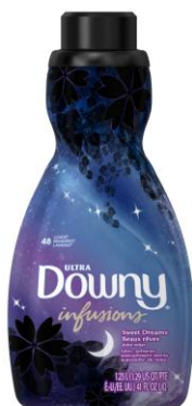
ダウニー インフュージョン (スウィートドリームズ他) 1230ml 569 円 原産国:アメリカ 人気の柔軟剤ダウニーの新しい香り「スウィートドリームズ」を含む商品を圧倒的低価格で発売。