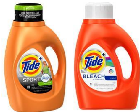
タイド (スポーツ、ブリーチ他) 1360ml 1297 円 原産国:アメリカ 全米 No.1 の衣料用洗剤。お試しサイズ (306ml 297 円) も好評販売中。