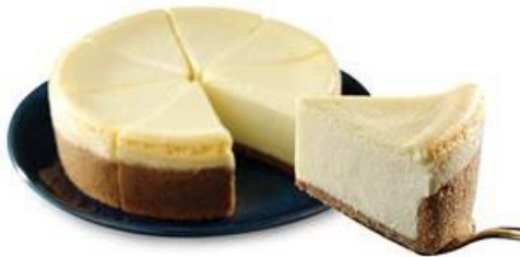
ザ・チーズケーキ・ファクトリー オリジナルチーズケーキ 964g (8 ピース) 1980 円 原産国:アメリカ 有名レストランのチーズケーキが新登場。 ※関東店舗のみで販売

また、今年の夏より品揃えを順次拡大している日用品も、輸入雑貨店でも人気の高い柔軟剤や洗濯用洗剤など魅力的な商品を多数揃え、低価格で販売いたします。