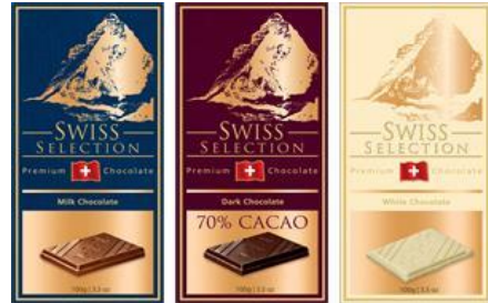
スイスセレクション (ミルク、ダーク、ホワイト) 100g 199 円 原産国:スイス スイスの伝統的製法で作られた、なめらかな味わいの板チョコレート。