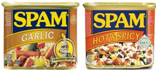
スパム (ガーリック、ホット&スパイシー) 340g 358 円 原産国:アメリカ 人気のスパムより、風味豊かで調理のアレンジもしやすい新フレーバーが登場。