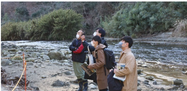
学生の現地視察の様子