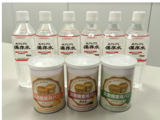
防災備蓄品（テナント配布用）