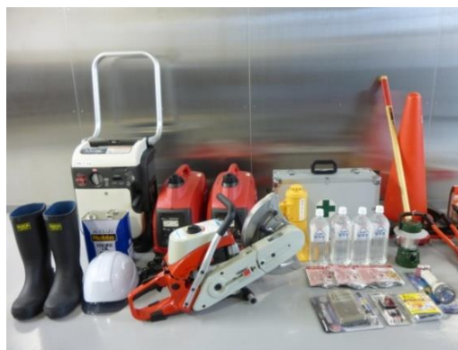
防災備蓄品（ビル備蓄用）