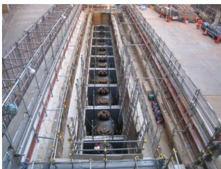
霞が関ビルディング オイルタンク増設工事

非常用発電機およびオイルタンクを増設し、稼働時間を72時間に延長しました。これによりビル共用部に加えテナント専有部への72時間の電力供給が可能になりました。