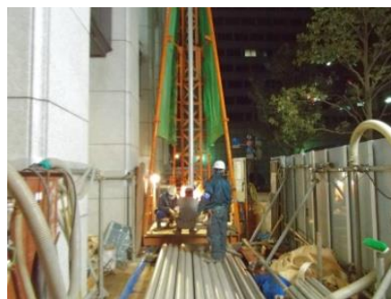
日本橋三井タワー 井戸掘削工事