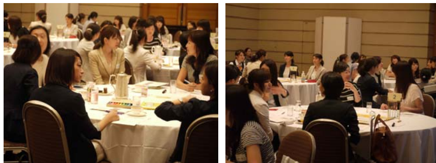
▲スモールトークの様様