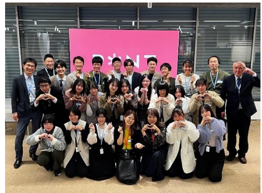
※静岡県立袋井高等学校の生徒および教職員

PYNTでは将来世代である中高校生の企業見学の受け入れやワークショップを実施し、「ありたい未来」についての考えや行動の共有や共感醸成を支援。3月18日に清風南海高等学校、3月26日に静岡県立袋井高等学校の生徒や教職員の方を対象に共創について学ぶの講義と「学校を今よりも良い場所にする方法」をテーマとしたワークショップを開催し、個人のアイデアを起点に、自分だけではできないと思っていたことが誰かを巻き込むことで実現可能性が高まる実感や、仲間と共通意識を持って発想を広げることで「こうだったらいいのに」が具体化されていく感覚を楽しく体験できたという感想を多くいただいた。