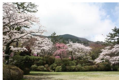
箱根小涌園 蓬菜園