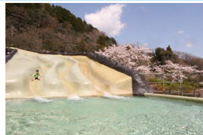
ユネッサン / ロデオマウンテン