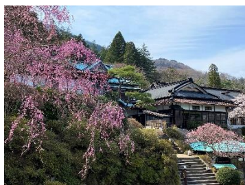
箱根小涌園 三河屋旅館