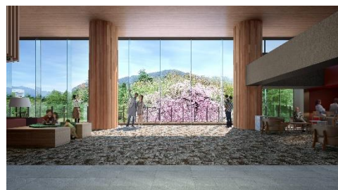
箱根ホテル小涌園(イメージ)