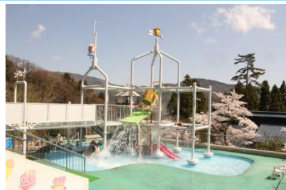
ユネッサン/ボザッピのジャングルジム