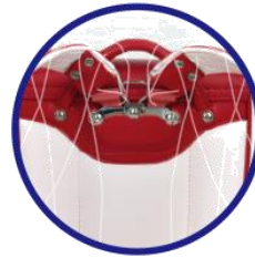
ランドセル「背カン」

ランドセルの肩幅を調整する「背カン」を採用し、ショルダーが左右に動くことによりどんな体形の肩にもフィットしてずれにくいリュックです。出張や旅行時にも便利な、拡張機能付きと大きく開けるキャリーケース型の2タイプ展開です。