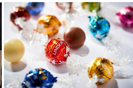
リンツ ショコラ ブティック