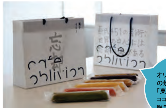
▲焼き菓子セット「菓子451」 販売価格：1,250円(税込)

オリジナルパッケージの焼き菓子セット「菓子451」。ココでしか手に入らない限定品です！