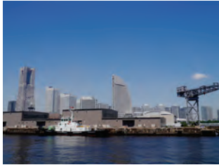
▲海に面した新港ピア会場。カフェからはベイブリッジや鶴見つばさ橋などを眺めることができます。