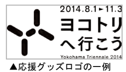
▲応援グッズロゴの一例

もう一つの主会場である横浜美術館のミュージアムショップでも、公式グッズはもちろん、一部応援グッズや出品作家関連商品も販売しています。