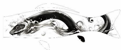
＜竜鯉門＞ / 落合陽一

【協 力】 駐日イラン・イスラム共和国大使館、駐日ウクライナ国大使館、駐日エクアドル共和国大使館、駐日ギリシャ大使館、駐日セルビア共和国大使館、駐日ハンガリー大使館 リスト・ハンガリー文化センター、駐日ボリビア多民族国大使館、駐日モルディブ共和国大使館、駐日リトアニア共和国大使館、駐日レソト王国大使館、公益社団法人日本グラフィックデザイン協会、多摩美術大学 TUB、港区、Art and Art History Department, University of Hawai'i at Mānoa、MORI by Art+Flea、株式会社徳永こいのぼり ほか(予定)