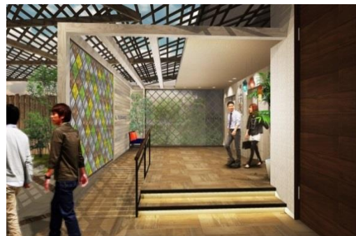
<「L.TERRACE」エレベーターホールイメージ>