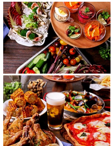
<メニューイメージ>