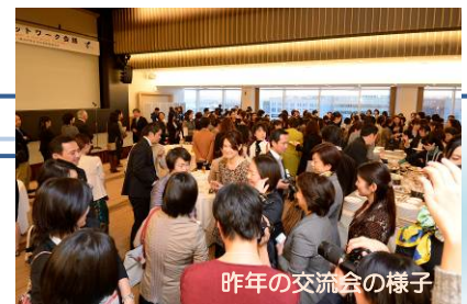
昨年の交流会の様子