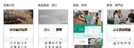
▲サイト構成イメージ