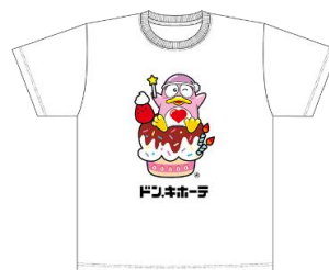
2024 ドンコ生誕祭限定デザイン T シャツ