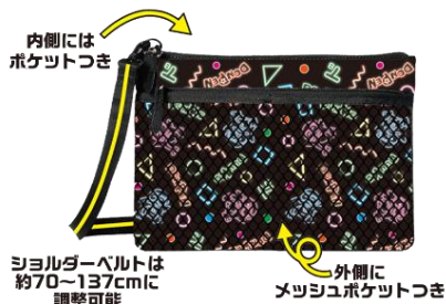
ドンペンショルダーバッグ<総柄>

2023 年より開催されたドンペンファンを集めた『ドンペンサミット』を通じて、ファンの声をカタチにしたグッズを続々と開発中です。第二弾として『ドンペンショルダーバッグ<総柄>』が 3 月 1 日(金)に発売しており、デザインはもちろん、使いやすさにもこだわった商品となっています。また、#ドンコ生誕祭 2024 を記念した限定デザイン T シャツも、同日発売しています。