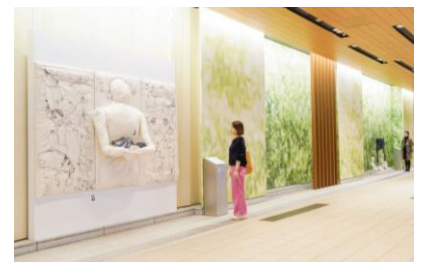
▲ストリートミュージアム(昨年の様子)

2024 年 3 月 15 日(金)~4 月 14 日(日) / 東京ミッドタウン館内