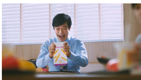
パウダーいれて シャカ♪シャカ♪