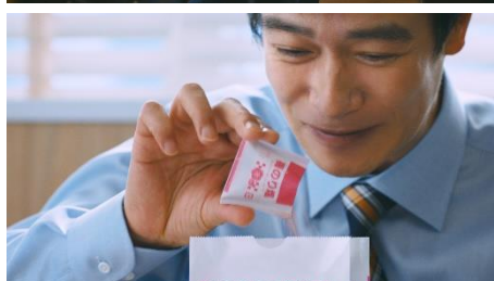
シャカシャカポテト〜