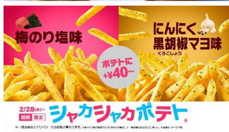
シャカシャカポテト♪