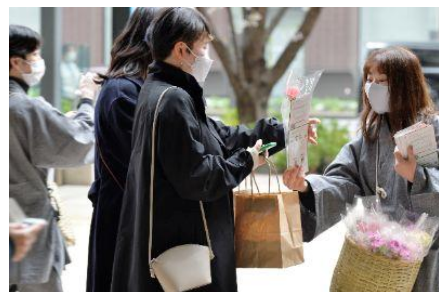
花の無料配布（イメージ）