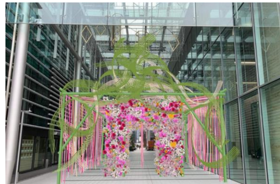
プレゼントボックスパース（イメージ）

夜にはフラワーアートがライトアップされ、煌びやかな姿で東京ミッドタウン八重洲の1周年を彩ります。