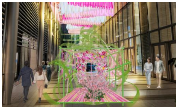
Moment of Bloomパース（イメージ）

東京ミッドタウン八重洲1Fガレリアに登場する「Moment of Bloom」は、竹造形と春の花々とリボンで織りなす、プレゼントボックスのような大型フラワーアートです。日本伝統の素材「竹」、ヨーロッパ由来の「リボン」、そして春の訪れを告げる7,000輪を超える花々の一輪一輪が、職人の緻密な手仕事によって融合し、豊かな色彩と形で訪れる人々の心を魅了します。来街する人々に素敵な未来が訪れることを願ったフラワーアートで、訪れる人々にまるで未来への贈り物を受け取ったかのような感動の瞬間をお届けします。華やかに彩られた祝祭感のある期間限定の特別空間をお楽しみください。