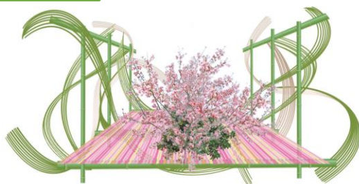
春の小道パース（イメージ）

生命力あふれる桜の木々を中心に春の花々をリボンに織り込み、春の訪れを華麗に表し、プレゼントボックスまでの高揚感を演出します。職人による竹と桜とリボンの見事な融合をお楽しみください。