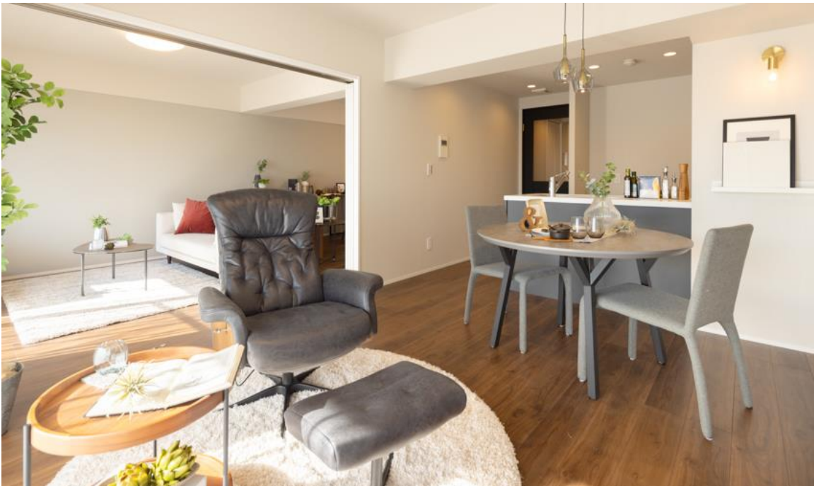
リビング・ダイニング、洋室

大和ハウスグループの株式会社コスモスイニシアは、マンションにおける二世帯同居をテーマに、一つの住戸に高齢の独り暮らしの親と成人した単身の子がほどよい独立性を保ちながら同居するスタイルにリノベーションした『ヴィラヴェール武蔵新城』の1室を販売開始いたしましたのでお知らせします。