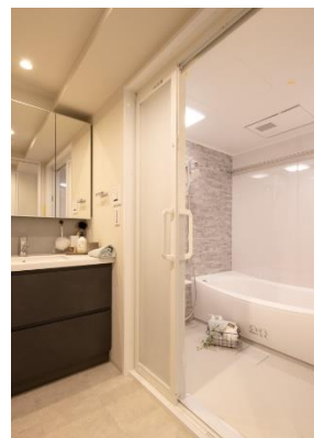
L型洗面／キッチン／浴室