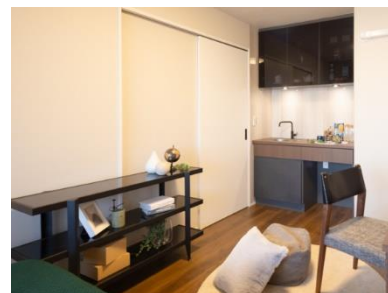
洋室（子どもの部屋）

共用のキッチンの他に、子どもの部屋にはシンク付きバーカウンターを設置。シンクと小さな冷蔵庫置き場やお気に入りのグラスなどが飾れるガラス戸付きの仕様です。仕事で帰りが遅くなった日も音を気にせずちょっとした食事や仕事終わりの一杯をお楽しみいただけます。