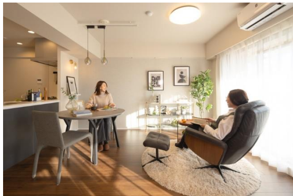
リビング・ダイニング

それぞれの部屋で音を気にせずに過ごせるよう、親の部屋と子の部屋は収納スペースを挟んで直接接しないようにゾーニングしています。