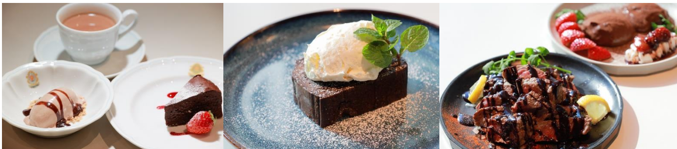
▲ロスチョコレートを活用した限定メニュー（一部抜粋）