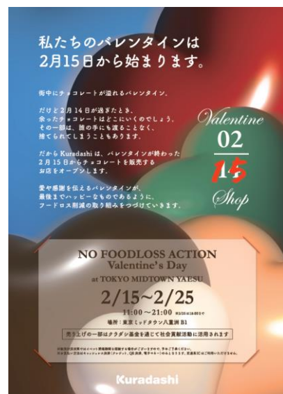
▲イベントメインビジュアル

東京ミッドタウン八重洲は、“ジャパン・プレゼンテーション・フィールド”のコンセプトのもと、新しい価値を生み出し、発信していくことを街づくりに掲げています。そんな中、クラダシの掲げる「身近な社会課題をイベントを通して新たな価値として発信・啓発する」というコンセプトに共感し、施設での開催が実現いたしました。東京ミッドタウン八重洲でチョコレートを楽しみながら、気軽に「フードロス」解消という社会課題解決にも貢献できるイベントにぜひお越しください。