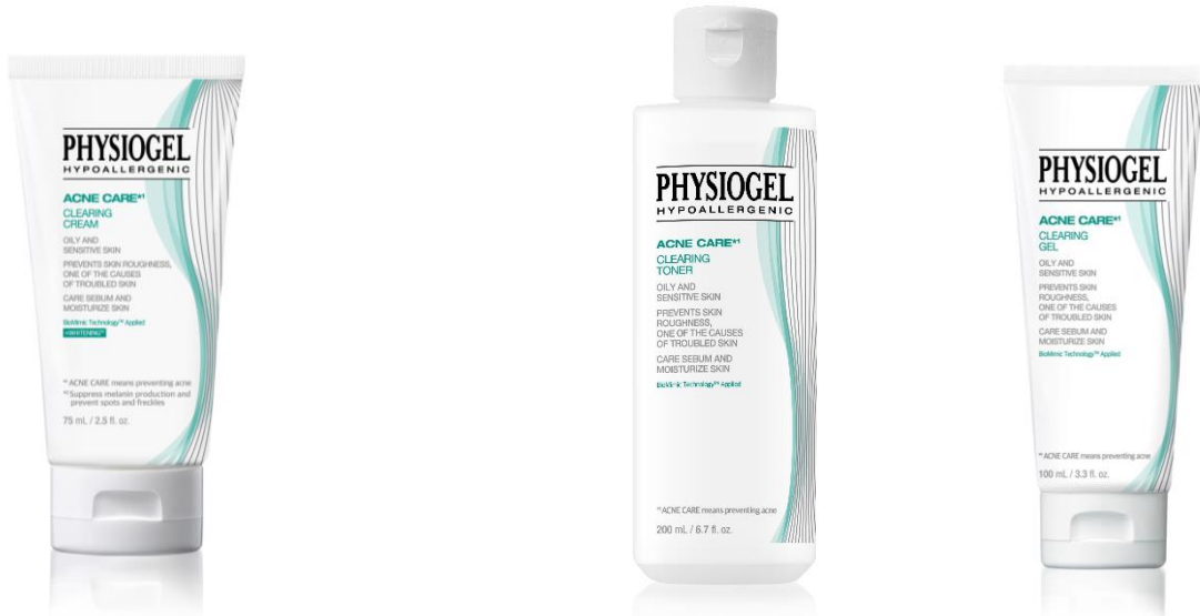
アクネケア クリアリング フェイシャルクリーム [医薬部外品]

さらに、北海道で自然発酵した酵母エキス (*) と、植物性オウゴンエキス (*) を配合しており、肌コンディショニングを整えるため、油性肌ケアにもおすすめです。