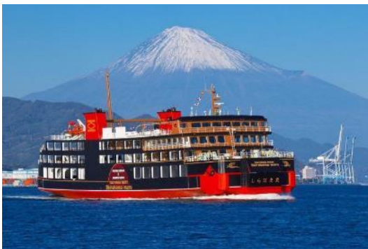
清水港にて試運転を行う黒船（しらはま丸）

東京湾フェリー株式会社 所有船舶 しらはま丸 総トン数 3,351 トン 全長 79.1m 航海速力 時速約 24 km 旅客定員 680 名 車両積載 バス 12 台 乗用車 105 台 トラック 36 台 他オートバイ 自転車も乗船可能