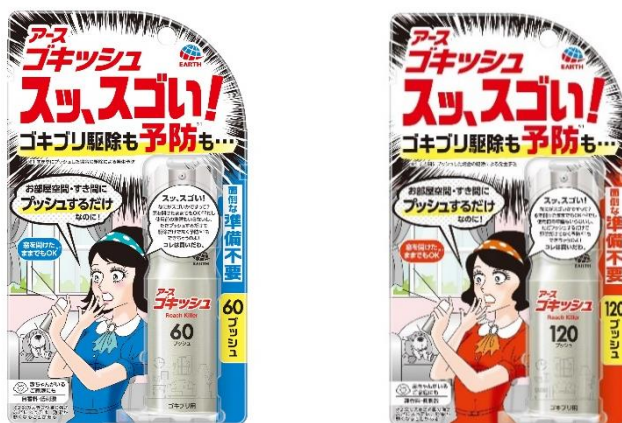
『ゴキツシュ スツ、スゴい！ 60プッシュ（左）／120プッシュ（右）』

アース製薬株式会社（本社：東京都千代田区、社長：川端克宜、以下「アース製薬」）は、効果と手軽さを追求し、窓を開けたまま ※1 でも使用できる 1 プッシュタイプのゴキブリ対策商品『ゴキツシュ スツ、スゴい！』を全国で発売しました。