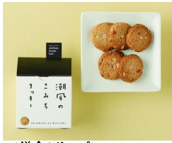
<鎌倉ツリープ> 「潮風のみちクッキー」 639 円/5 枚入(税別)