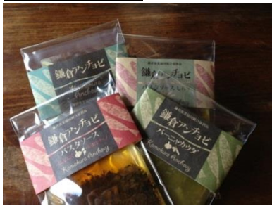
<鎌倉ダイニング> 「鎌倉アンチョビシリーズ」 各 500 円(税別)