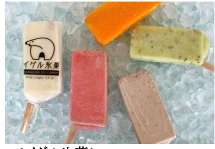
<イグル水菓> 「アイスクャンディー」 各 186 円～(税別)