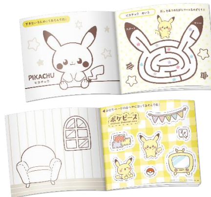
【ピカチュウ (ぬりえ)】