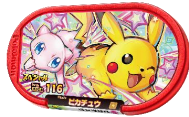
【ピカチュウ&ミュウ】