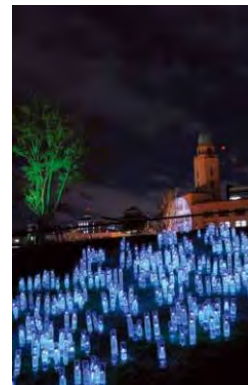
2013年最優秀賞受賞作品 Light Bottles