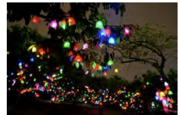
写真は2013年の様子 スマートイルミネーション新治 2013