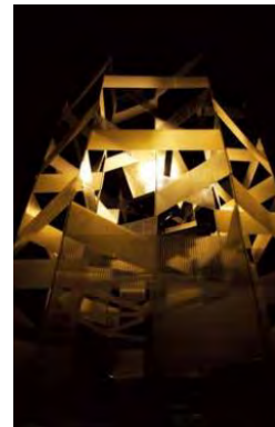
2013年最優秀賞受賞作品 TO/TO透/燈