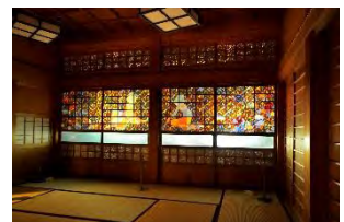
写真は昨年(2013年)の新治の様子(緑区)