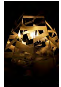
写真は2013年の最優秀賞受賞作品 『TO/TO 透/燈』Artist/LENGA