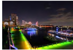
写真は2013年の様子