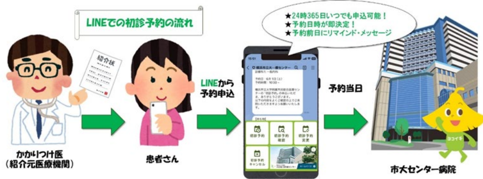
図2 LINE を活用した予約システム導入後のイメージ