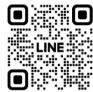
横浜市大センター病院 LINE 公式アカウント