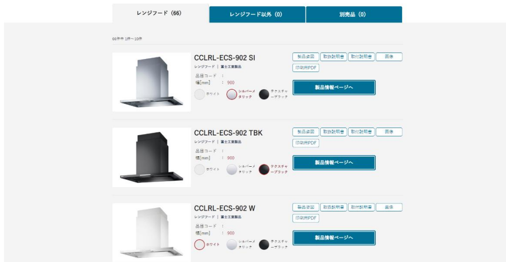
FUJIOH ビジネス向け情報サイト イメージ

※1 富士工業グループは、一般家庭用レンジフード供給台数国内シェア No.1。(2021 年 4 月東京商工リサーチ調べ ODM 生産品を含む) FUJIOH は、富士工業グループの企業ブランドです。