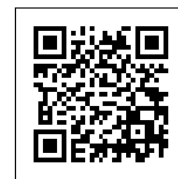
「おえかきハッピーホットケーキ」