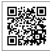
「チキンフィレオ ハバナロマト」