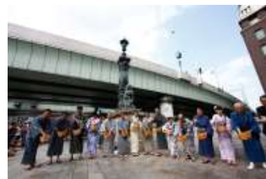
橋の日 打ち水大作戦 (昨年の様子)

内容：日本橋の橋上で“打ち水”を実施します。ゲストや来賓者の挨拶に始まり、浴衣姿の地元の方や女性による打ち水により、日本橋から“日本の夏の涼”を発信します。