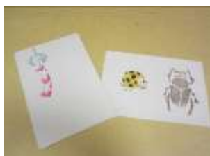
「合羽摺り × 和紙はがきづくり」 (イメージ)