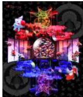
アートアクアリウム 2014