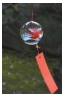
日本橋 風鈴めぐり (イメージ)

昨年に引き続き木村英智氏がプロデュース。江戸時代から夏の風物詩として日本人に親しまれてきた“金魚”をテーマに、和をモチーフにデザインされた水槽と、光・映像など最新の演出技術が融合した水中アートの展覧会です。新作も日本橋でお披露目されます。