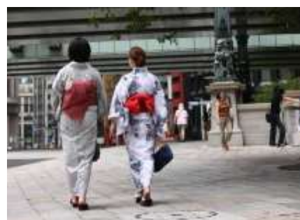
ゆかた・アートアクアリウム特典 (2012 年の様子)