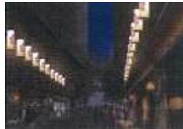
2014年 春のライトアップの様子