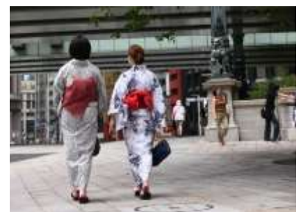
ゆかた・アートアクアリウム特典 （2012年の様子）