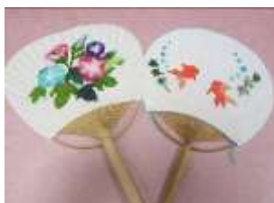
「和紙ちぎり絵 × うちわづくり」 (イメージ)