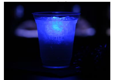
ほたるのひかりカクテル

販売時間：各日18時30分～21時00分 商品名：ほたるのひかりカクテル 販売価格：620円(税込み) ※ノンアルコールは500円(税込み) 商品内容：夕暮れの清流で光るホタルをイメージしました。柑橘リキュールが夏らしく爽やかなカクテルです。