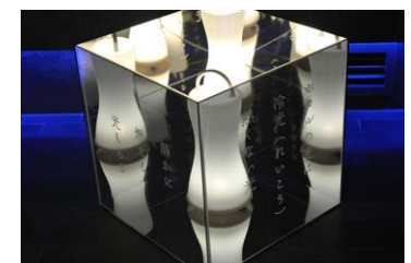
ほたるからのメッセージ