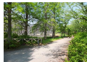
レジーナ横遊歩道

開催期間：2014年7月19日(土)、26日(土) 開催時間：各日19時15分～20時00分 開催場所：東武動物公園内 水上木製コースターレジーナ横遊歩道 開催内容：「ほたリウム」で育ったヘイケボタル約500匹を水上木製コースターレジーナ横の遊歩道へ放します。幻想的でどこか儂いホタルの光を自然の中でご覧いただけます。また、今年のテーマは「ほたる不思議発見!？」とし、“ホタルはなぜ光るのか?”そんな素朴な疑問を解決するため、光る仕組みが分かる実験コーナーや実体顕微鏡や虫眼鏡でホタルを観察できるコーナーが登場します。そのほか、オリジナルのホタルグッズを販売、ホタルと触れ合うことができる「放虫体験」も開催します。