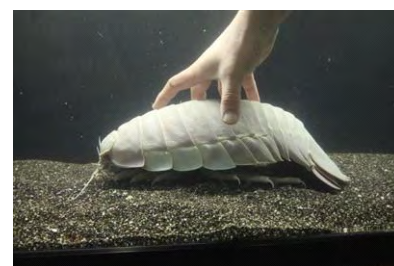
ダイオウグソクムシ

開催内容：オウムガイやカブトガニなど、古代よりあまり姿が変わっていない水生生物の展示を行います。