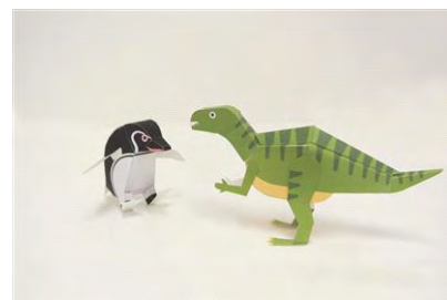
ペンギンと恐竜ペーパークラフト

開催日：2014年8月1日(金)～9月21日(日)の平日 開催時間：各日10時00分～17時00分(最終受付16時30分) 開催場所：5階 すみだステージ 参加定員：各日40名 参加対象：小学3年生以上 参加方法：当日申し込み 開催内容：『福井県立恐竜博物館』プロデュースのペーパークラフトワークショップを『すみだ水族館』で開催します。切り抜いて組み立てたら、自分だけのフクイサウルスが作れます。今回は、特別にペンギンのペーパークラフトとセットで作っていただけます。