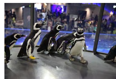
ハロー！ペンギン ～Penguin Meets Dinosaur～