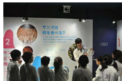
恐竜研究員のガイドツアー ※イメージ画像

開催日：2014年8月19日(火) 開催時間：〔子ども向け〕11時00分～12時00分 〔大人向け〕19時30分～20時30分 開催場所：館内各所 参加定員：各回20名 参加方法：事前募集 ※詳細は公式ホームページでお知らせします。 開催内容：福井県立恐竜博物館の研究員が、各種骨格標本を解説する特別なガイドツアーです。