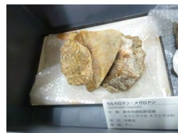
メガロドンの歯の化石標本

開催内容：実物の化石標本や福井県立恐竜博物館の研究員がピックアップした恐竜に関する書籍などを設置します。夏休みの自由研究にぴったりです。