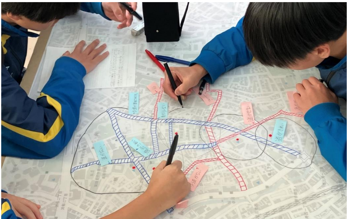
図3・避難経路マップ（避難経路の歩行容易性を表した地図）

日建設計では今後もこうした取り組みを通じ、渋谷の防災意識向上を目指すとともに、ワークショップの知見を生かしたAccessibility Mapのさらなる開発と普及により、渋谷区だけでなくより広い社会の安心・安全へと貢献してまいります。