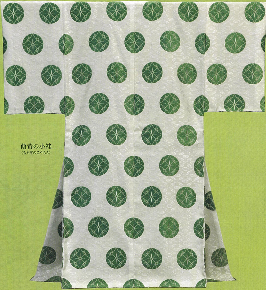
萌黄の小袿 (もえぎのこうちき)

本展では再現装束のほか、完成に至るまでの研究課程を紹介し、本プロジェクトの学問上への寄与、技術の検証、継承の意義深さもご覧いただければ幸いです。約千年前の雅な世界をじっくりと鑑賞、お楽しみ下さい。