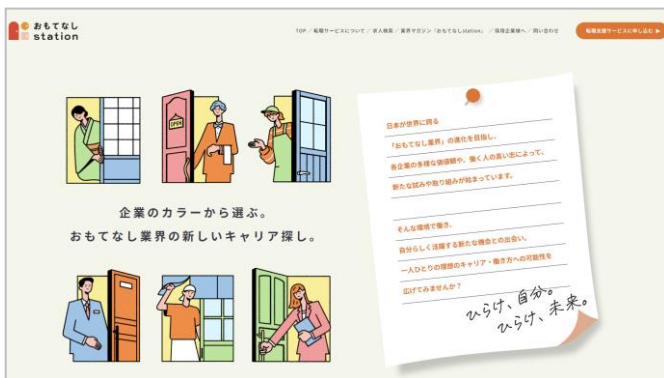
▲ 転職支援サービス

同社では、宿泊・飲食・ブライダル業界を主な対象とし、人材紹介をはじめとする各種サービスを提供して参ります。日本が育んできた付加価値の高いサービスを提供する業界の価値を、国内外から一目置かれる『おもてなし産業』というブランドに再定義し、『おもてなし産業』の発展を通じた豊かな社会の実現に向け、関わりある人や企業が集い、互いに寄り添い合えるコミュニティを構築します。人材不足という根本的な課題解決を主に、新たな価値創造への变革をリードしてまいります。