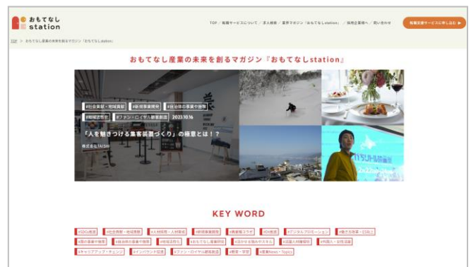
▲ おもてなし産業マガジン