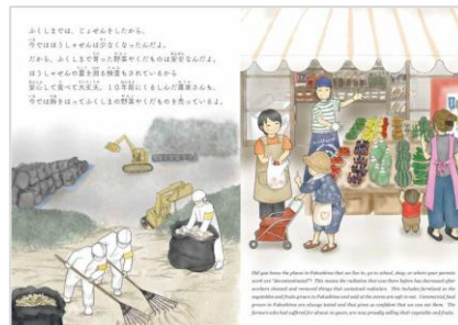
▲ 絵本『ふくしまからのメッセージ』

※3：震災を知る・学ぶ・考える機会を提供するとともに、新たな語り部として次の世代へ伝える役目を果たせるよう支援することを目的に活動している絵本プロジェクト。