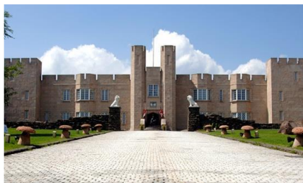
▲ ブリティッシュヒルズ

フィールドワークを振り返りながら、感想の共有をおこない、英語のエッセイにまとめます。外国人教員による原稿チェック、発表方法のレクチャーを経て、宿泊最終日には一人ずつ英語でスピーチをおこない、世界に発信する意欲を醸成します。