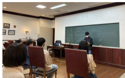
▲ ブリティッシュヒルズでの発表の様子(昨年)