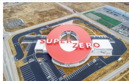
▲ フタバスーパーゼロミル

東日本大震災・原子力災害伝承館や請戸小学校の見学、(一社)双葉郡地域観光研究協会(※1)の協力による双葉町のまち歩き、浅野燃系(株)(※2)の双葉事業所「フタバスーパーゼロミル」の施設見学をおこない、被災地の方から講話をいただくことで、「福島の記憶と今」を見つめます。