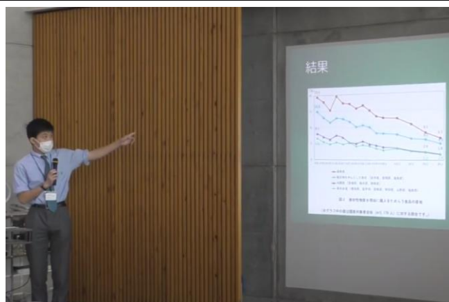
▲ 神田外語大学での最終発表の様子(昨年)