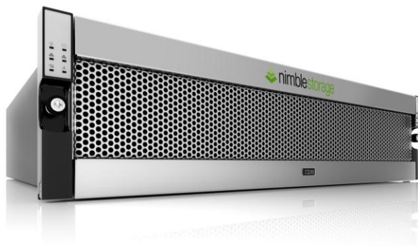
<「Nimble Storage CS シリーズ」 画像>

「ニンプルストレージは、日本においてネットワンパートナーズと協業することを嬉しく思います。主要なポジションを築き、かつ、鍵となる提携技術を有している各国のディストリビュータとの協業は非常に重要だからです。この度の協業によってリセラーは、高性能・高効率なニンプルストレージ製品と業界をリードするCisco UCSサーバを組み合わせ、データベースやデスクトップ仮想化・サーバ仮想化のための主要なアプリケーションを提供することが可能となります。お客様への貢献を通じて、ネットワンパートナーズとともに成長していくことを楽しみにしています。」